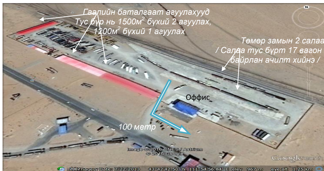
Зураг 1. Компанийн байршил

Тус компани нь Дорноговь аймгийн Замын-Үүд сумын 1-р баг, 10-р хэсэгт буюу Хятад улсаас манай улстай хиллэж байгаа хамгийн том боомт Эрээн хотоос 10 километр, улсын хилийн хаалтаас 100 метрт байрладаг ба энэ нь үйлчлүүлэгч байгууллага, иргэнд хамгийн тохиромжтой байрлалд тооцогддог.