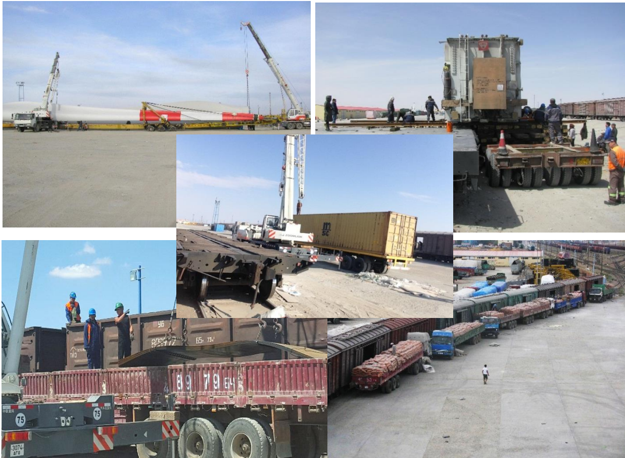
Зураг 3. Шилжүүлэн ачилт хийгдэж байгаа нь

Замын –Үүд суманд ачаа шилжүүлэн ачих терминалийн үйлчилгээ явуулж буй байгууллагуудын мэдээлэл: