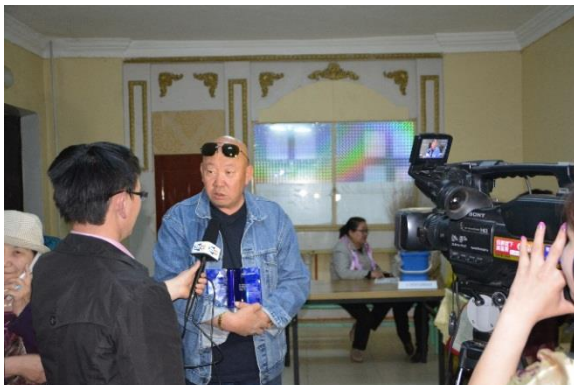
Зураг 9. Шагнал гардаж авлаа

байгууллага буюу Татварын албаны дээд шагнал хөх дэвтэр эзэмшигч байгууллагаар Дорноговь аймгаас 3 аж ахуйн нэгжийг шагнасны нэг нь тус компани шалгарч шагналаа гардаж авлаа.