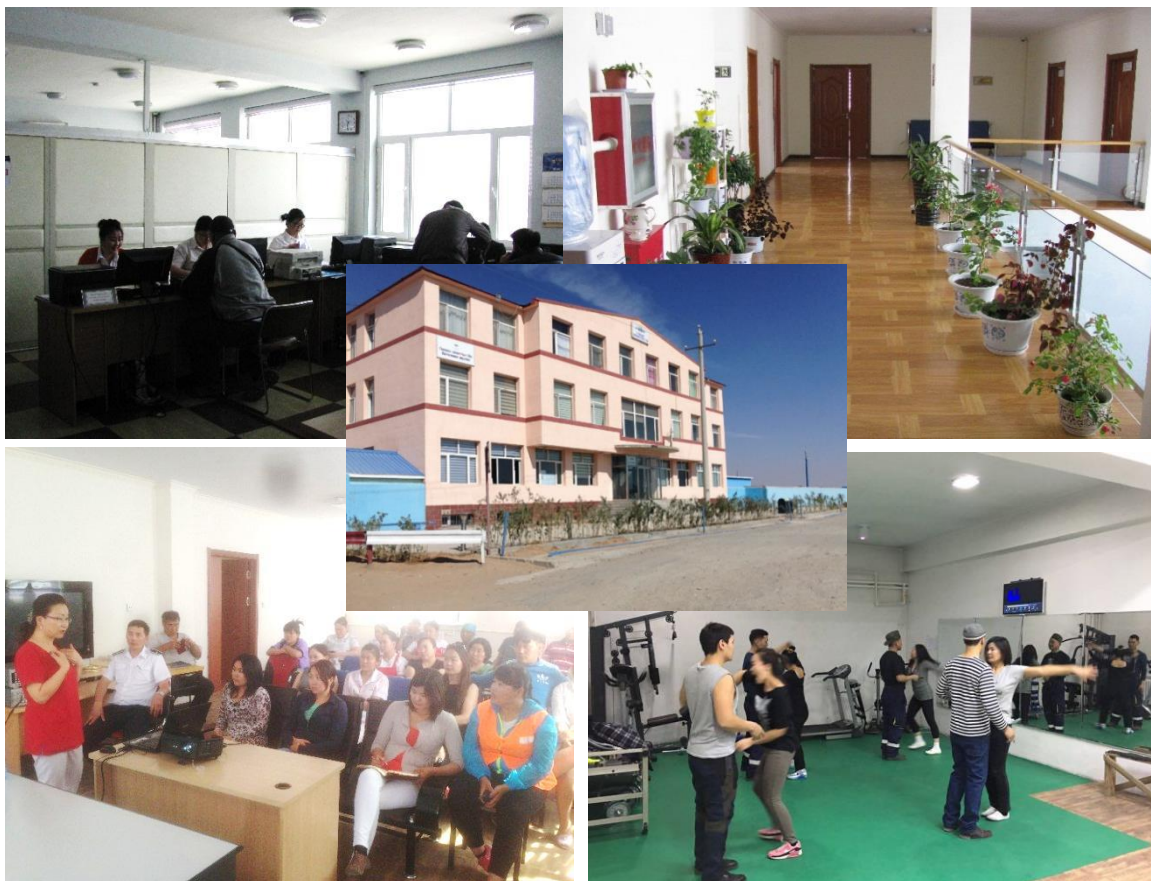
Зураг 2. Гаалийн нэг цэгийн үйлчилгээ бүхий оффис

Гаалийн нэг цэгийн үйлчилгээний танхим бүхий оффисын барилгыг 2012 онд барьж байгуулан улсын комисст хүлээлгэн өгсөн бөгөөд одоо тус байгууламжийн 1-р давхарт гаалийн нэг цэгийн үйлчилгээ үзүүлэх танхим / үүнд: гаалийн ахлах болон улсын байцаагч, хилийн мэргэжлийн хяналтын байцаагч нарын ажил үүргээ гүйцэтгэх өрөө тасалгаанууд, гаалийн бүртгэгдсэн мэргэжилтэн нарын ажлын байр, банкууд, компанийн ачаа тээврийн алба болон цайны газар байрлана /, 2-р давхарт компанийн захиргаа удирдлагын өрөө тасалгаанууд, 3-р давхарт компанийн ажилчдын 9 айлын байр, зочид төлөөлөгчдийг байрлуулах 3 өрөө, подвалийн