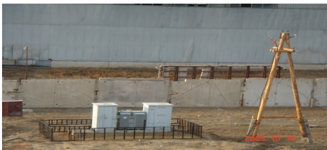
Эрчим хүчний шугам КТП барьж 400 квт-ын цахилгаан эрчим хүчинд холбогдсон.