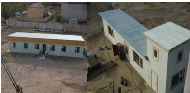
Оффисын барилга, цахилгааны шит, операторын байр