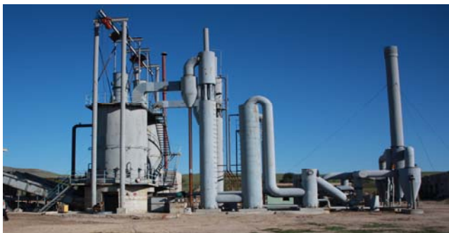
NR-3200 маркын коксын зуух