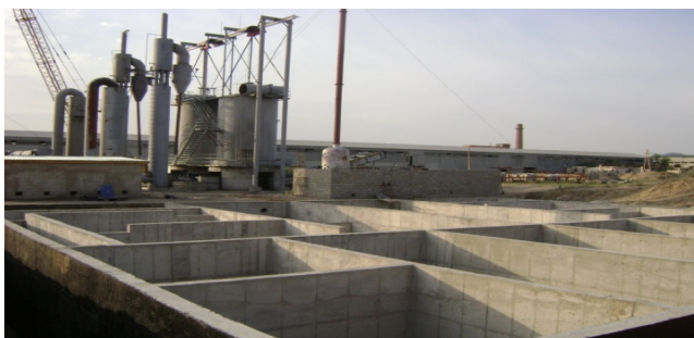
Тосон болон усан сангийн