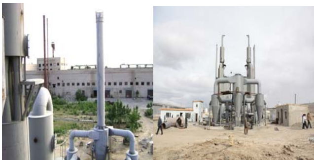
Шатдаг хийн байгууламж