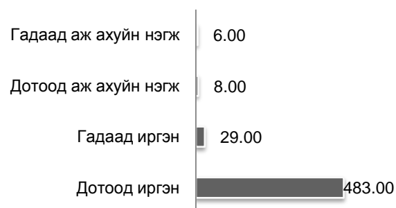
Зураг 2 Хувьцаа эзэмшигчдийн тоо бүтэц, 2011/03/20-ний тархалтын мэдээгээр