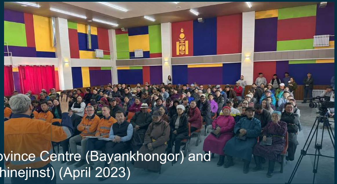
MMC & ERD CEO's Opening Representative Office in Province Centre (Bayankhongor) and Hosting an Open House Event in Sub-Province Centre (Shinejinst) (April 2023)