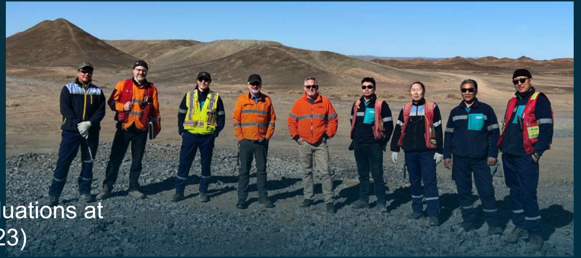
ERD Discovery Team Geologists Conduct Field Evaluations at Bayan Khundii, Dark Horse and Zuun Mod (April 2023)